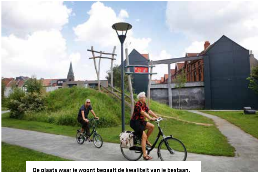
De plaats waar je woont bepaalt de kwaliteit van je bestaan.

het beleid of de projecten en betrek de ervaringsdeskundigen erbij: zij kunnen het best uitleggen wat ze nodig hebben. Vertaal hun inzichten in een goed onderbouwde visie en ga dan pas aan de slag. Dit vraagt tijd én omdenken, maar ambities, beleid of projecten die voeling hebben met de leefwereld van mensen waarvoor ze bedoeld zijn, hebben ook wel een grotere kans op succes. Bepaal van daaruit richting en prioriteiten en ga op zoek naar gelijkgestemde partners in andere beleidsdomeinen.